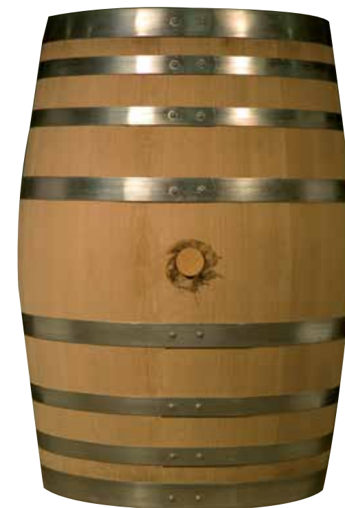
Bourgogne 228 L 8 cercles galvanisés